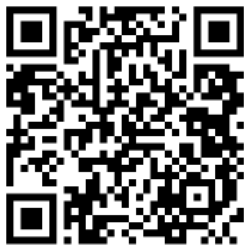
＜入学説明会の特設サイトQR＞